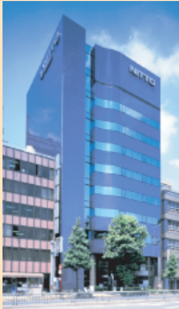
(株)日東建設 本社ビル