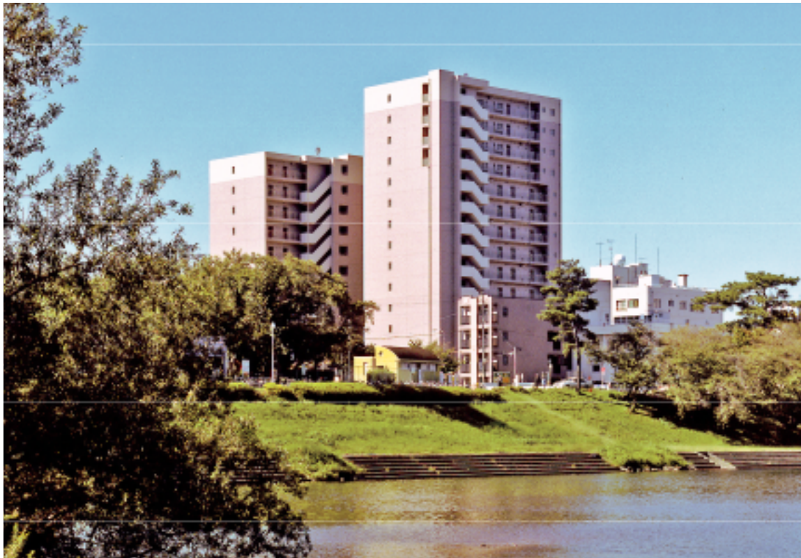
カーサビアンカ東岡崎(平成18年10月竣工) 岡崎市明大寺町/HRC造15階・12階 延6,293.6㎡/賃貸マンション151戸